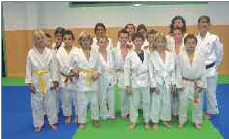
Une salle lumineuse et parfaitement sécurisée