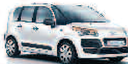
CITROËN C3 Picasso VTi 95 Attraction

jusqu'à 5 000 € (2) d'Avantage Client Sous condition de reprise Bonus Écologique de 500 € inclus