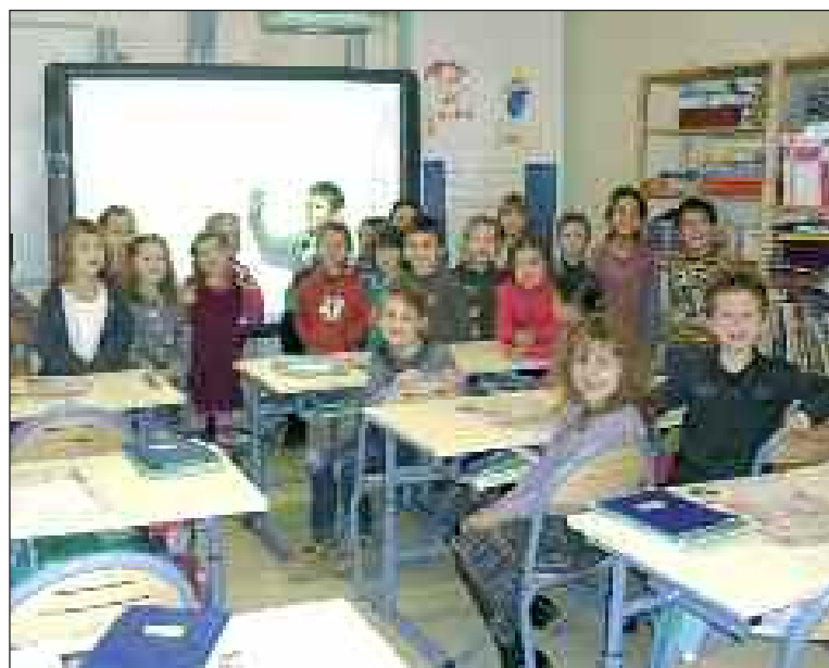
La classe de GS/CP, son tableau blanc interactif et son mobilier neuf

C'est avec une joie mêlée de curiosité que les élèves de grande section et cours préparatoire et de cours moyen 2 ont découvert un étrange tableau blanc le jeudi 7 octobre dans leur salle de classe.