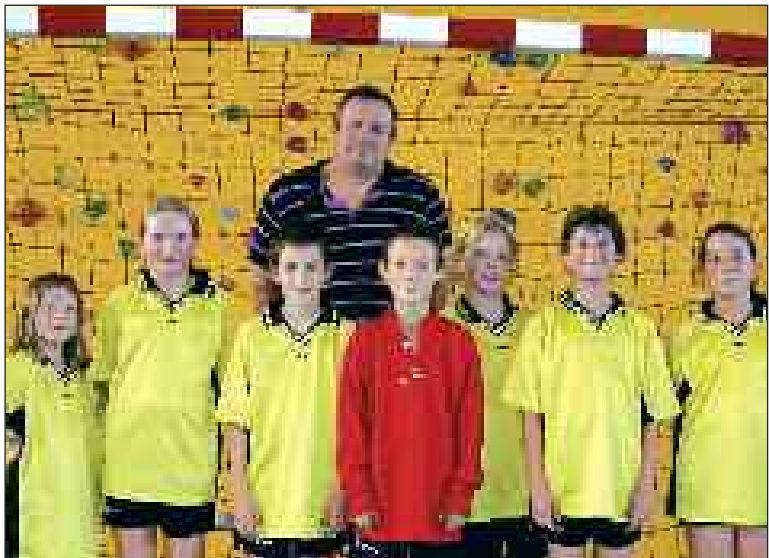
Les moins de 11 ans