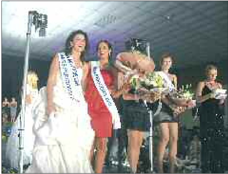
La couronnement en compagnie de Miss Aquitaine