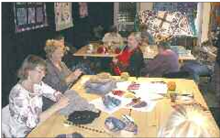
Un cadre fort agréable pour passer un excellent après-midi

Tous les dimanches de 14 h à 18 h à la filature, c'est le moment du café-tricot.