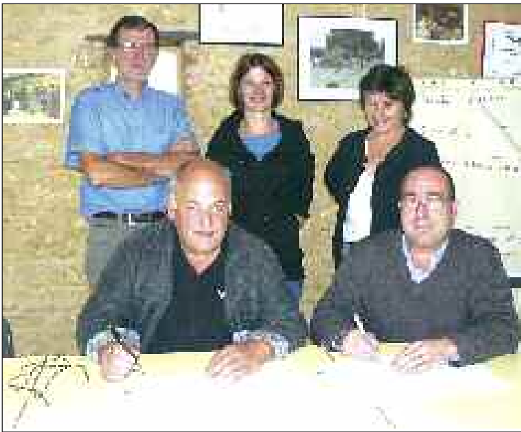
Lors de la signature de la convention