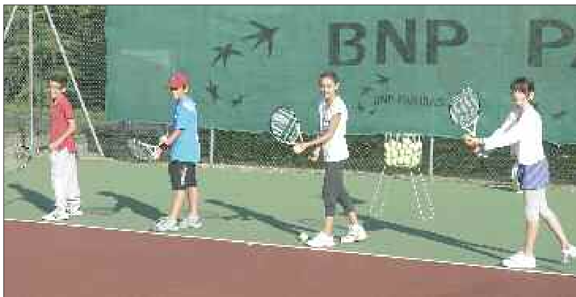
Un groupe de jeunes de l'école de tennis