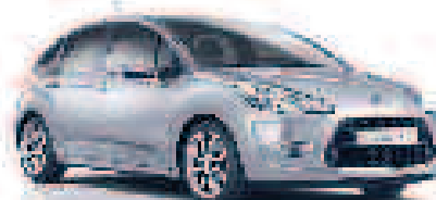
NOUVELLE CITROËN C3 HDi 70 FAP Exclusive

à partir de 5 690 € (1) Sous condition de reprise Bonus Écologique de 500 € déduit