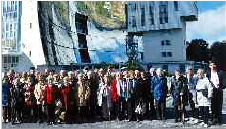
Devant le four solaire d'Odeillo lors du voyage à Font-Romeu

Un séjour est prévu l'an prochain du 28 mars au 2 avril, soit six jours et cinq nuits, à Sainte-Maxime dans le Var. Le massif de l'Estérel, Cannes, Grasse, les gorges du Loup, Gourdon, Saint-Tropez, Port-Grimaud, Ramatuelle, Fréjus, Les Arcs... seront au programme.