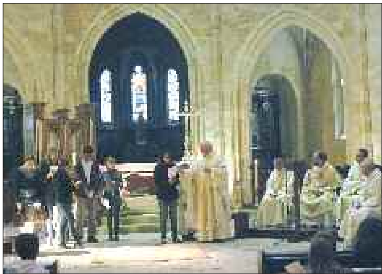
Les jeunes lycéens ont dit au revoir à leur aumônier