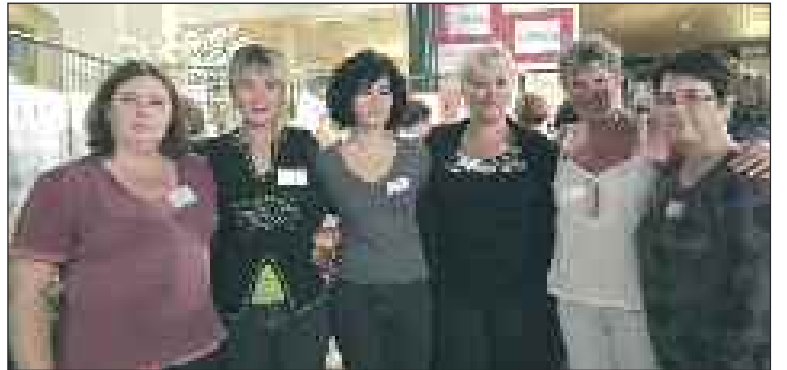
L'équipe des soins palliatifs