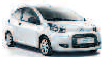
CITROËN C1 3 portes 1.0i Attraction

à partir de 5 690 € (1) Sous condition de reprise Bonus Écologique de 500 € déduit