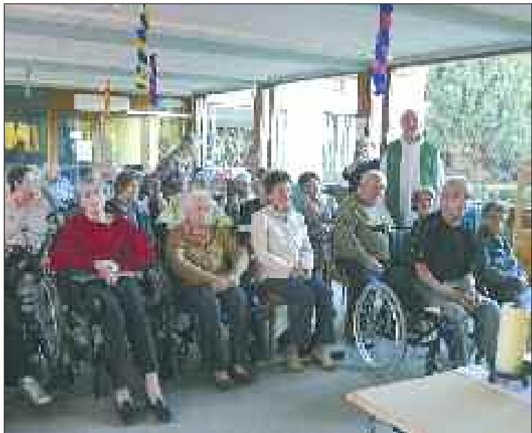
Les pensionnaires heureux de retrouver un prêtre